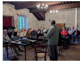
LES AMIS DE NOTRE DAME DU CROS