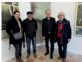
Exposition de peintures de Léon Diaz-Ronda Avril - Mai Et une lecture poétique autour de ses oeuvres donnée par Ana Tot