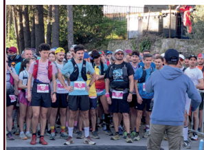
Trail de l'Argent Double avec les Groles Trotteurs