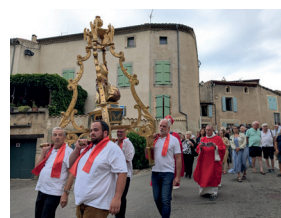
Procession des Saints Martyrs de Caunes