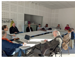
LES CONNEXIONS CULTURELLES