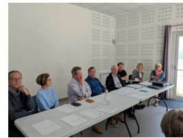
LES ARTS LIBÈRENT