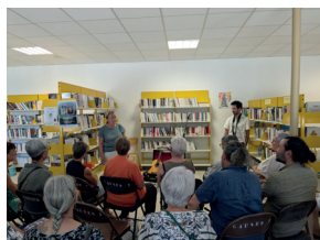
Spectacle avec la bibliothèque de l'Amicale Laïque de Caunes