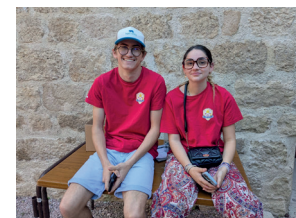
Soirée espagnole avec l'Amicale des Sapeurs-Pompiers