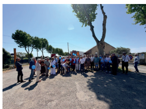
Journée contre le cancer avec les Closquemolles