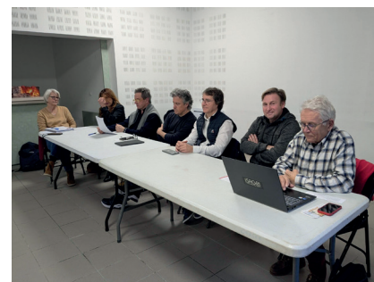
Les Arts Libèrent