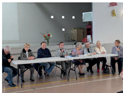
Le Club de l'Argent Double