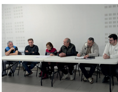
La Boule Incarnat