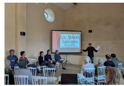
Les Ateliers Sauvages, Théâtre école