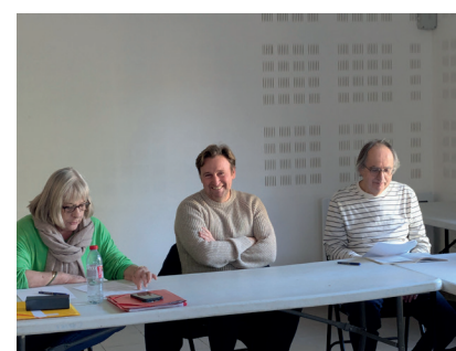
L'Union Loufoque Minervoise