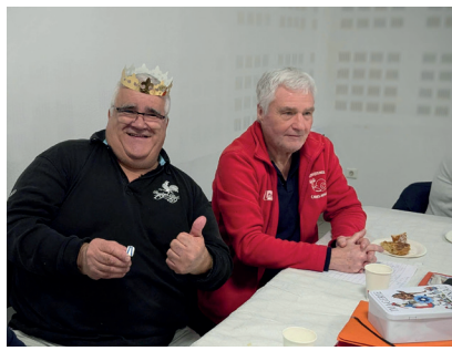
Anciens Combattants et Souvenir Français